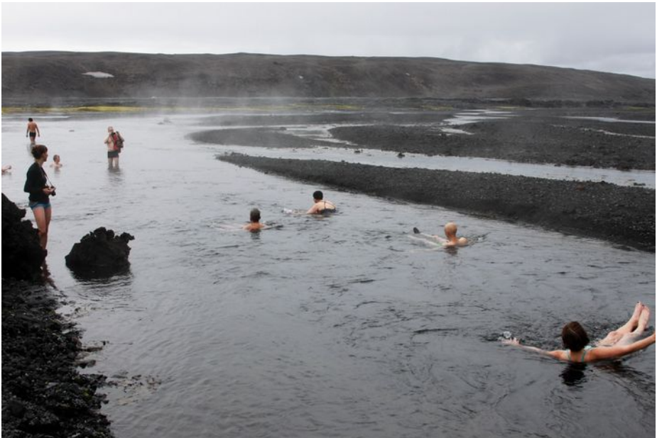
Þátttakendur í ágústferðinni lauga sig við Holuhraun.

Þar til í sumar hafði Jökklarannsóknafélagið aðeins einu sinni í 65 ára sögu sinni staðið fyrir skipulagðri ferð norður fyrir Vatnajökul. Það var 1964 þegar farin var hópferð til að kanna framhlaup Brúarjökuls. Veturinn 2014-15 urðu einnig hamfarir norðan Vatnajökuls þegar hraunið mikla rann á Dyngjusandi sunnan Öskju samfara öskjusigi í Bárðarbungu. Að þessu tilefni þótti stjórn félagsins kominn tími til að blása aftur til ferðar norður fyrir Vatnajökul. Var hún farin dagana 7.-9. ágúst. Lagt var upp frá Mývatni á föstudagsmorgni í rútu frá Gísla Rafni. Fyrst var komið við í Herðubreiðarlindum þar sem gist var næturnar tvær, en síðan haldið í Dreka þar sem landverðir tóku vel á móti hópnum. Við fórum næst að nýja hrauninu á Dyngjusandi og í stutta gönguferð um það undir leiðsögn Sigurðar Erlingssonar landvarðar. Einnig var farið að austustu tungu hraunsins. Þar fórum við í bað í ánni góðu sem sprettur undan hrauninu, með tæplega 40 gráðu heitu vatni. Þar er nú besta laug á Íslandi. Daginn eftir gengum við að